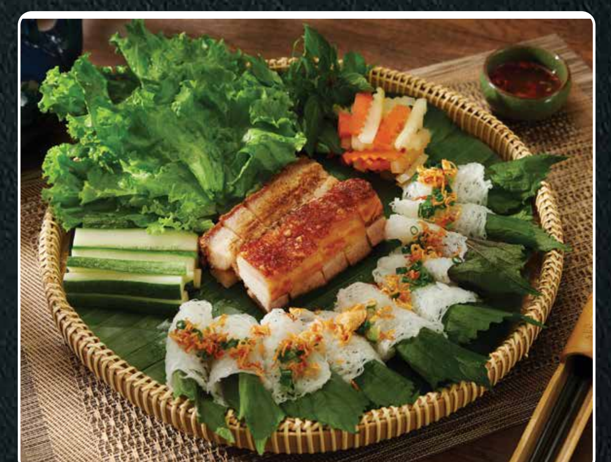
BÁNH HỜI HEO QUAY

Vietnamese rice vermicelli crepes with Roasted pork