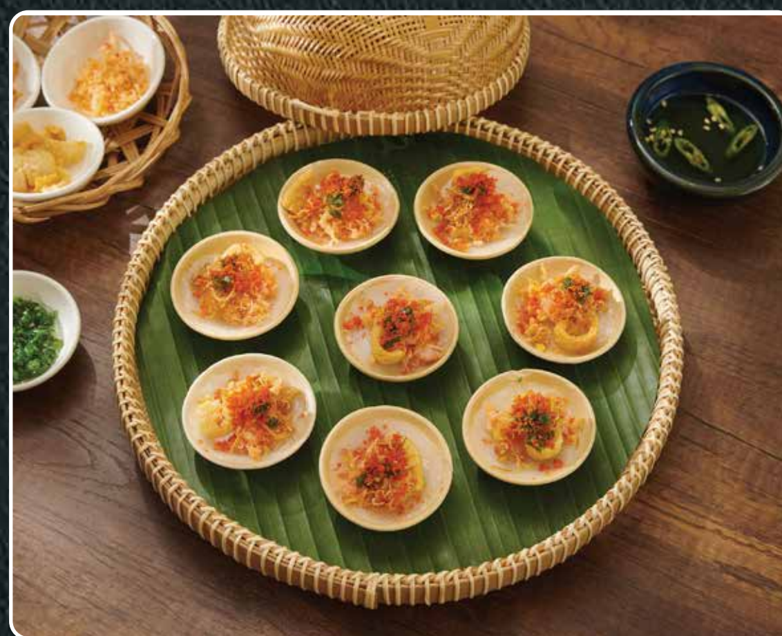
BÁNH BÈO HUẾ

Hue savory steamed rice cakes with shrimp