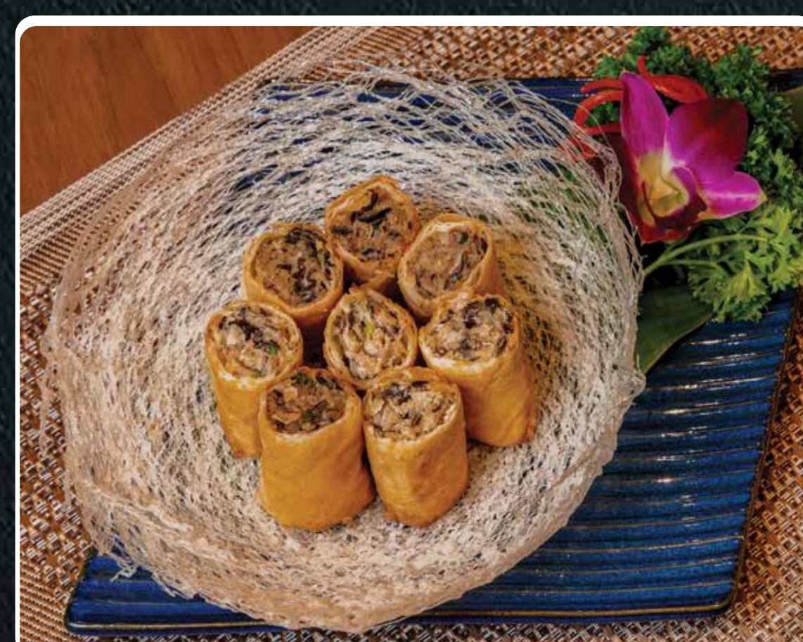
CHẢ GIÒ ĐẶC BIỆT