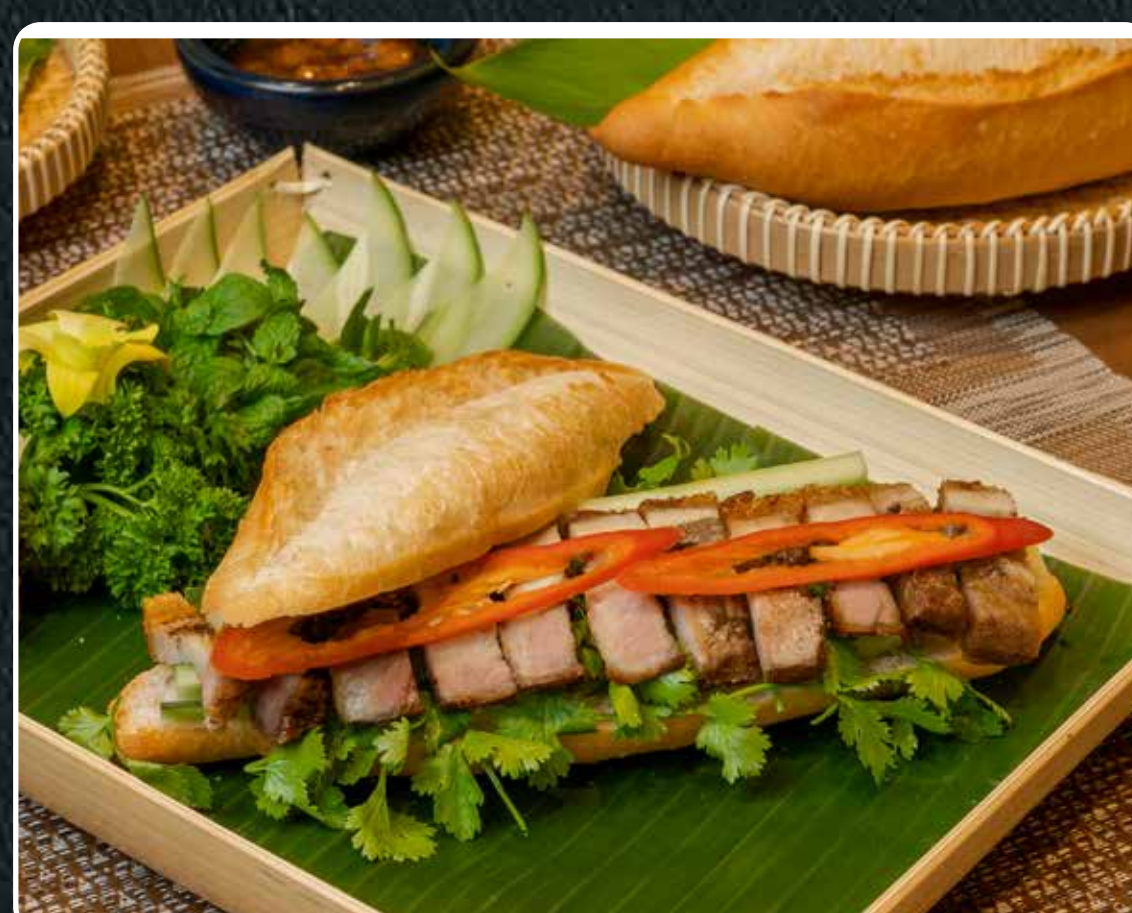
BÁNH MỠ HEO QUAY

Vietnamese roasted with pork house special sauce