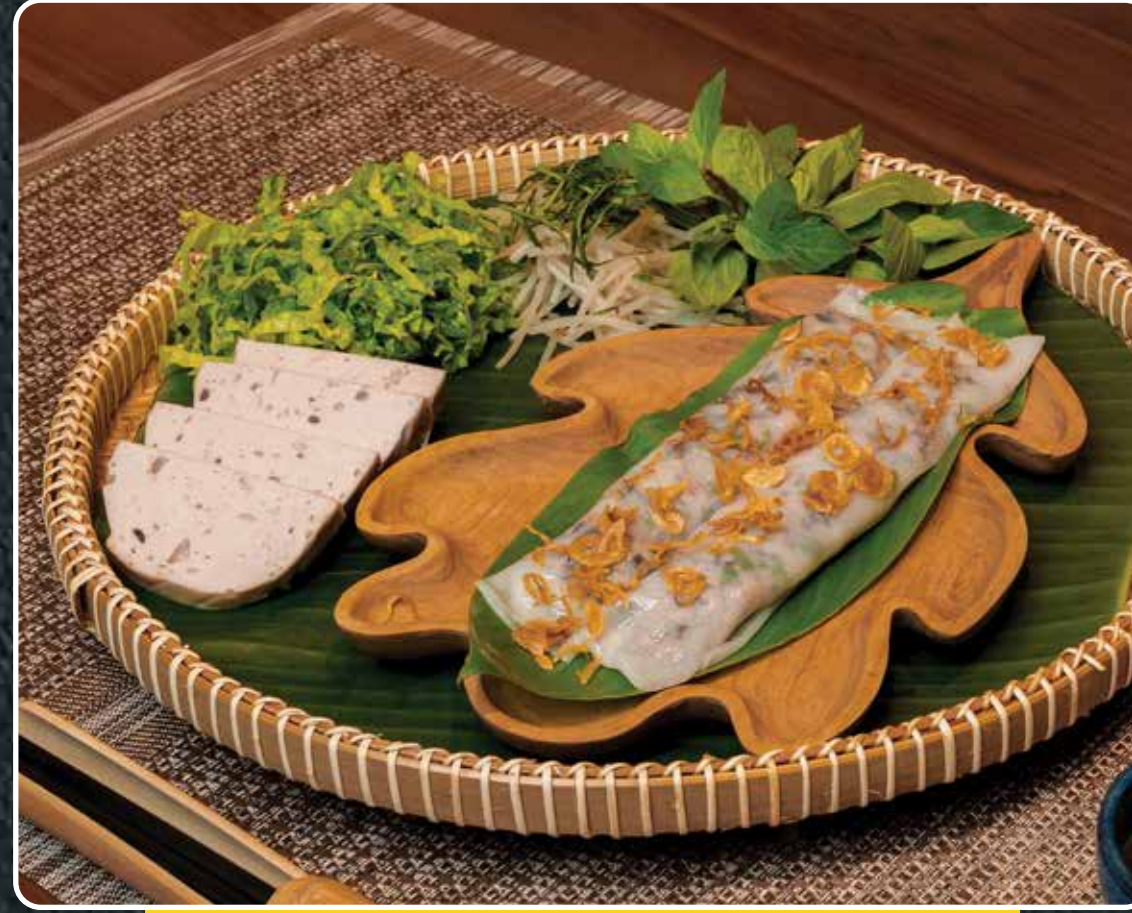
BÁNH CUỐN ĐẶC BIỆT

Ha Noi steamed rice cake with ground pork, tiger shrimp and vietnamese ham