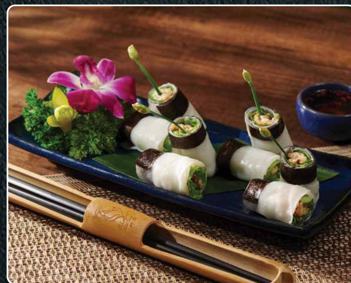
BÁNH CUỐN THỊT NƯỚNG

Vietnamese steamed rice rolls with grilled pork fillings