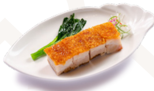
PORK BELLY | 삼겹살 구이 HEO QUAY GIÒN BÌ | 燒腩

+ SERVED WITH RICE & SOUP OF THE DAY & TEA | 밥과 오늘의 수프, 차 또는 소프 PHỤC VỤ CÙNG CƠM TRẮNG VÀ CANH TRONG NGÀY & TRÀ | 均配白米飯及今日例湯及茶