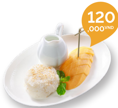
MANGO STICKY RICE