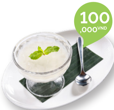
ALOE VERA & COCONUT JELLY