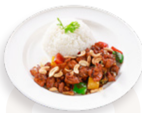
KUNG PAO CHICKEN WITH RICE 콩파오 치킨라이스 CƠM GÀ CUNG BẢO 宮保雞丁飯 220.000VND