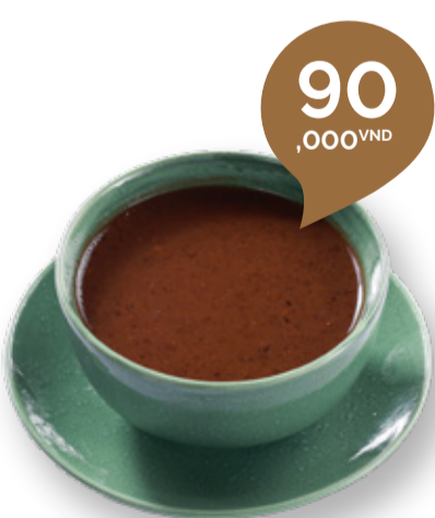
HOT OR CHILLED RED BEAN SOUP