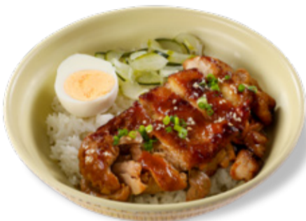
KOREAN TERIYAKI CHICKEN RICE 치킨 데리야끼 덮밥 CƠM GÀ SỐT TERIYAKI KIỂU HÀN QUỐC 韓式照燒雞扒飯 220.000VND