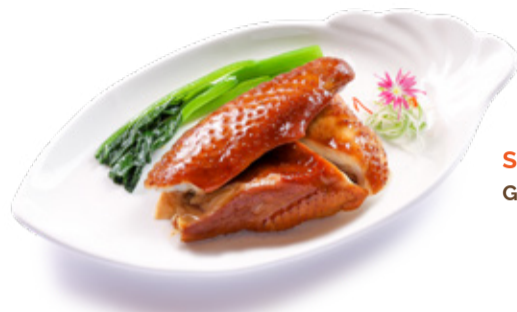
SOY CHICKEN | 간장 치킨 GÀ XÍ DẦU | 鼓油雞

CHOICE OF TWO BBQ | 바비큐 세트 4개의 메인 요리 중 2개 선택 CHỌN 2 TRONG 4 MÓN QUAY | 自選以下二款配