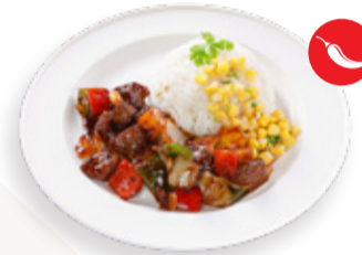
PEPPER BEEF WITH RICE AND SWEET CORN 후추양념 소고기와 밥 CƠM BÒ TIỂU ĐEN 黑椒牛柳粒飯 220.000VND