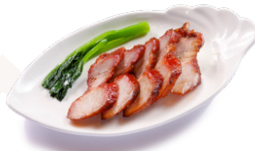
BBQ PORK | 차슈 XÁ XÍU | 蜜汁叉燒