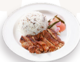
TANDOORI CHICKEN WITH BUTTER FRIED RICE 버터 볶음밥을 곁들인 탄두리 치킨 CƠM GÀ KIỂU ẤN 印度烤雞配牛油炒飯 240.000VND