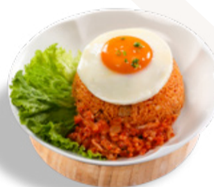
KIMCHI BOKKEUMBAP KIMCHI FRIED RICE WITH SPICY PORK 김치볶음밥 CƠM CHIÊN HÀN QUỐC 韓式豬肉泡菜炒飯 220.000VND