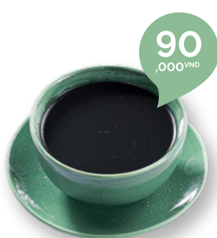
HOT OR CHILLED BLACK SESAME SOUP