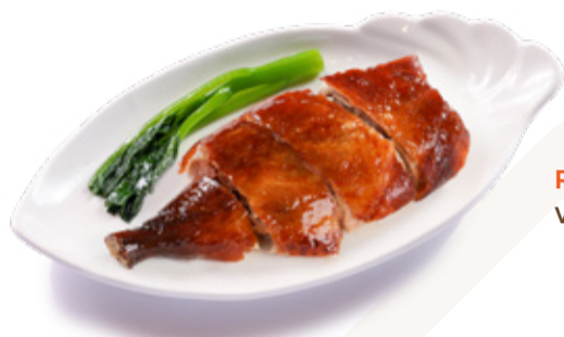
ROASTED DUCK | 오리구이 VỊT QUAY | 燒鴨