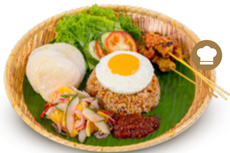
NASI GORENG 나시고랭 CƠM CHIÊN INDO 印尼炒飯 240.000VND