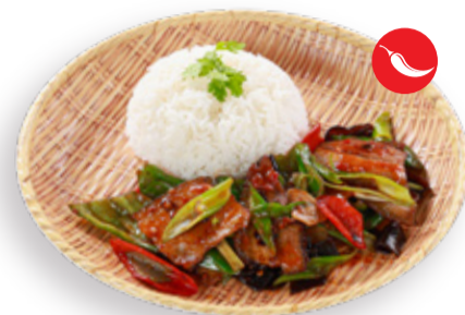
FRIED PORK BELLY AND PEPPER SICHUAN STYLE WITH RICE 사천식 삼겹살 구이 덮밥 CƠM THỊT HEO XÀO TỨ XUYÊN 四川回鍋肉飯 220.000VND