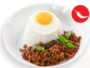
CHILLI & THAI BASIL PORK WITH RICE 패드 크라 파오 무 - 칠리와 바질로 볶은 다진 돼지고기 CƠM THỊT HEO BÂM KIỂU THÁI 泰式炒肉碎飯 220.000VND