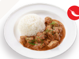
CHICKEN TIKKA MASALA WITH RICE 치킨 티카 마살라와 밥 CƠM GÀ MASALA 印度馬沙雞配白飯 240.000VND