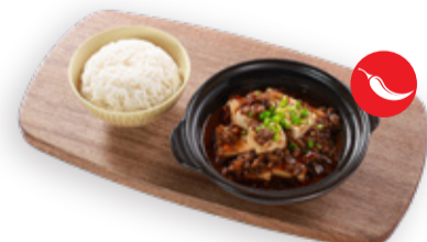
BRAISED BEAN CURD WITH MINCED BEEF AND RICE 마파두부밥 CƠM ĐẬU HŨ KIỂU TỨ XUYÊN 麻婆豆腐飯 220.000VND