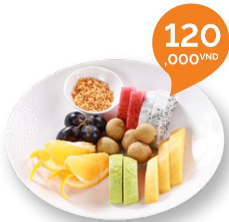
MIXED FRESH FRUIT PLATE