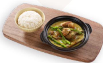
THAI GREEN CURRY WITH CHICKEN AND RICE 치킨과 밥을 곁들인 타이 그린 커리 CÀ RI THÁI XANH NẤU VỚI THỊT GÀ KÈM CƠM TRẮNG 泰式青咖喱雞飯 220.000VND