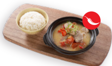
TOM KHA GAI COCONUT CHICKEN SOUP WITH RICE 툼 카가이 - 닭고기와 찐 밥을 곁들인 코코넛 수프 SÚP THỊT GÀ NƯỚC CỐT DỪA ĂN KÈM CƠM TRẮNG 泰國椰汁雞飯 220.000VND